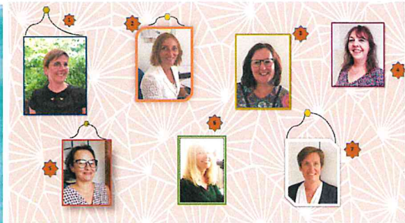
Le service AESH 67 année 2021/2022